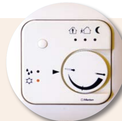
NETZFREISCHALTUNG: Funktioniert in Kombination mit der Schlüsselkarte