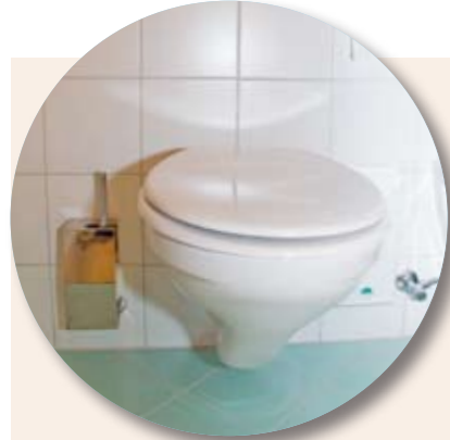
ÖKOLOGISCH: Regenwasser und Nutzwasser aus dem Saunabereich für's WC