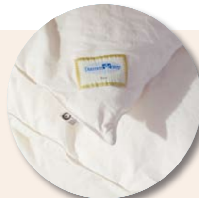
MATRATZEN: Hochwertige Leinenstoffe, Kern aus Flachs und Naturkautschuk