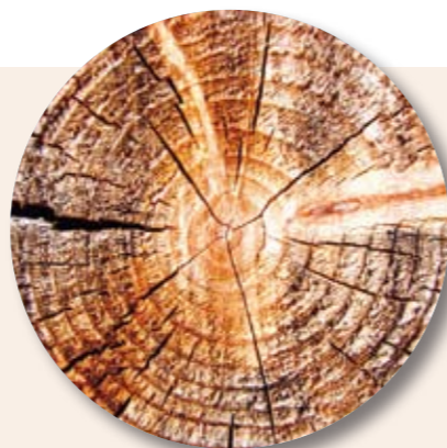
NATUR PUR: Böden und Einrichtung aus massivem Holz. Sogar die Waschtische!