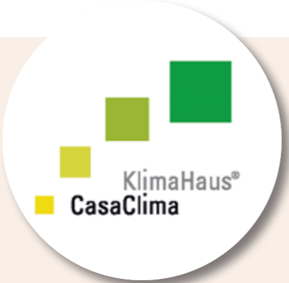
AUSGEZEICHNET: Im Jahr 2007 wurde die KlimaHaus B plus Plakette verliehen