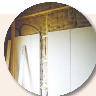
WANDHEIZUNG: Gibt Wärme gleichmäßig ab, verringert damit den Heizbedarf