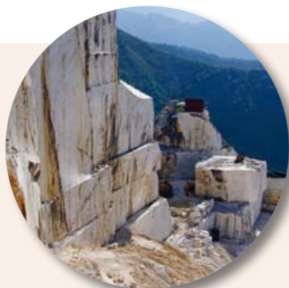
TRITTSCHALLDÄMMUNG: Sie gehen auf hochwertigem Laaser Marmorsand