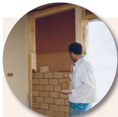
LEHMZIEGELWÄNDE: Südwände aus Lehm, der die Raumwärme natürlich reguliert