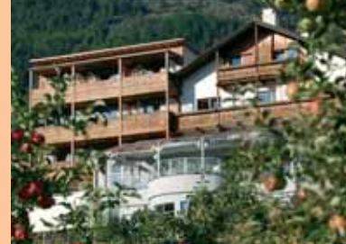
... idyllischer Lage