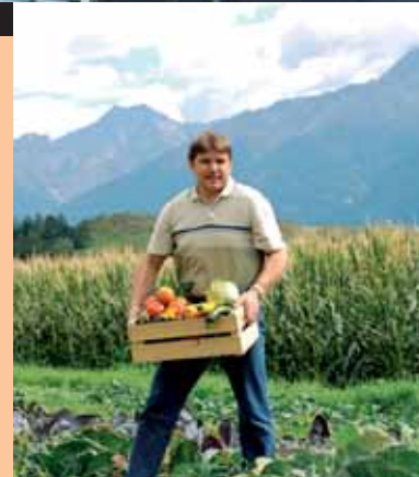
... eigener Biolandwirtschaft