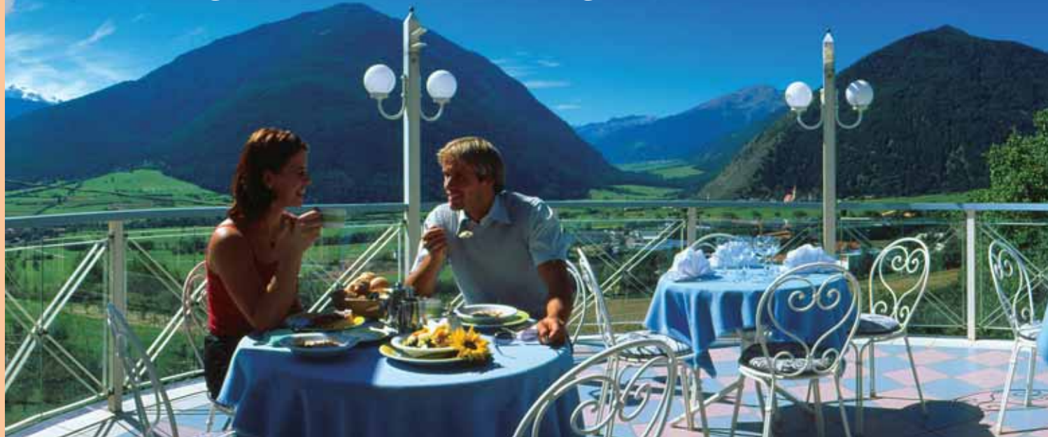
Das Bio-Hotel Panorama im Südtiroler Vinschgau lockt mit einem sensationellen Ausblick ...

Die Welt gehört dem, der sie genießt. GIACOMO LEOPARDI