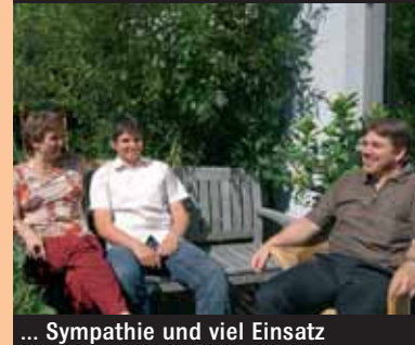
... Sympathie und viel Einsatz