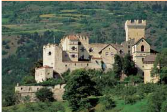
MALS UND UMGEBUNG HABEN VIEL ZU BIETEN, VERSETZEN DEN REISENDEN IMMER WIEDER IN STAUNEN.